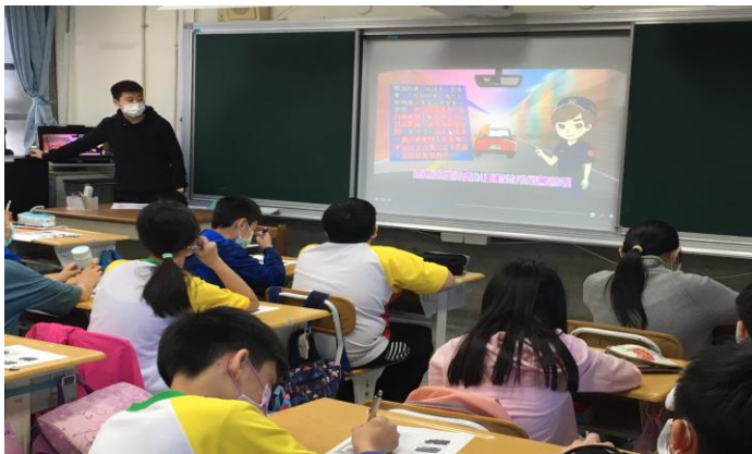
教師講解哪些車輛有優先道路使用權，說明未禮讓或未遵守交通規則會由警察依據處罰條例進行處分