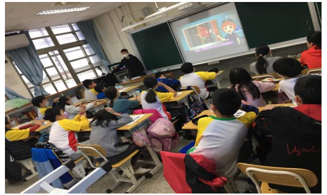
教師說明:依照道路交通標誌、標線、號誌之指示行車，才能創造安全便利的優質交通環境。