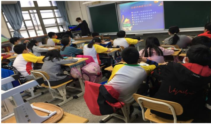
說明:建立路權觀念、培養禮讓精神及遵守路權習慣