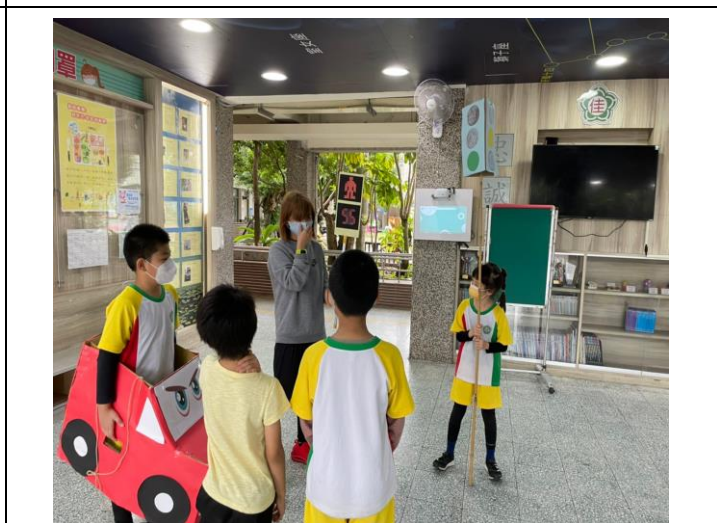
利用道具，模擬過馬路需注意些什麼需做些什麼 讓學生進行實際演練