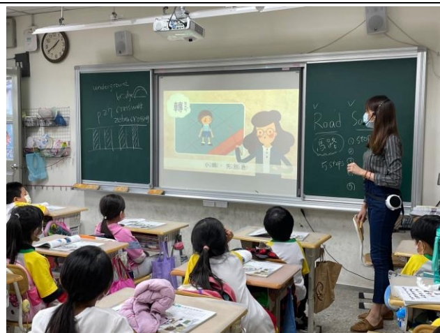
行人過馬路 5 步驟教學