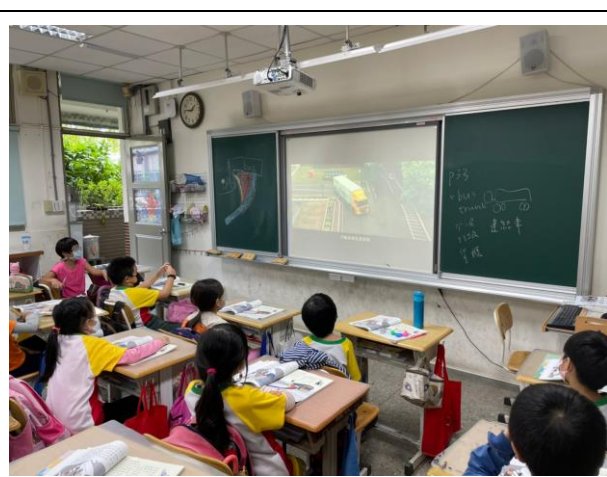
教師於綜合課搭配影片範例進行視覺死角教學，讓學生更能理解其危險性