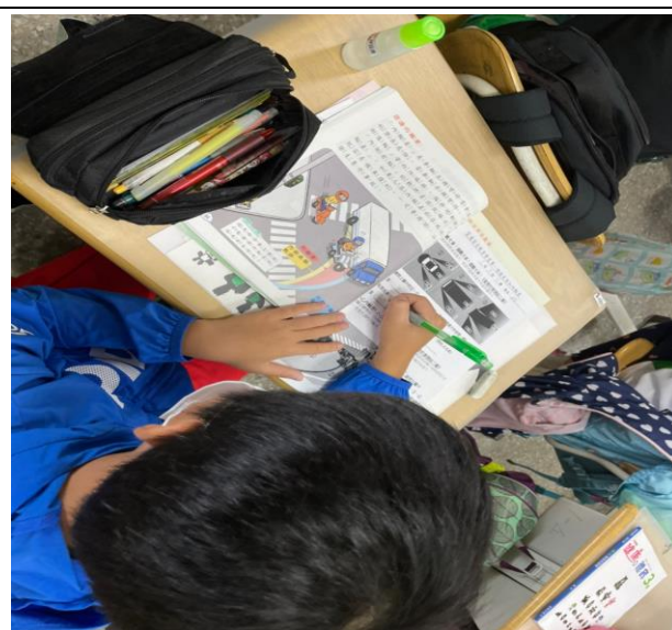
於課程結束寫學習單

交通安全知識知多少：各組上臺分享各組對於交通安全知識的認識以及學習到什麼樣的上課內容