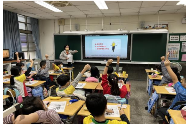
說明：裝備齊全後，在正式上路之前，還需要徹底檢查腳踏車的各個部位是否狀況良好。