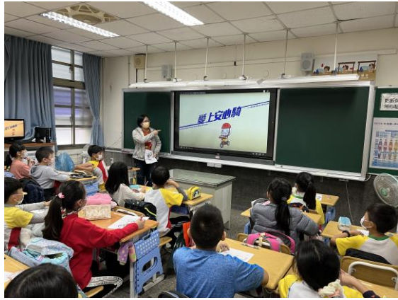
說明：教師說明騎車時應注意的安全距離：