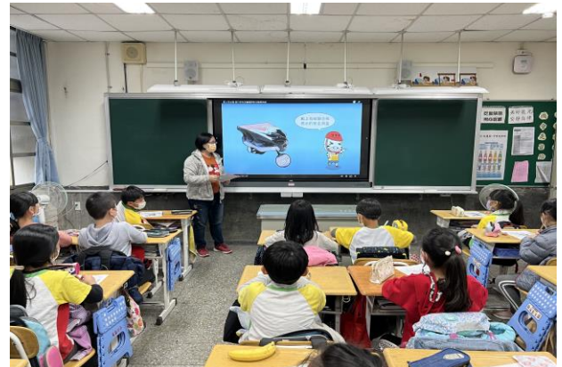
說明：教師展示數張錯誤的騎車方式，請學生觀察並討論錯誤之處與改進之道。