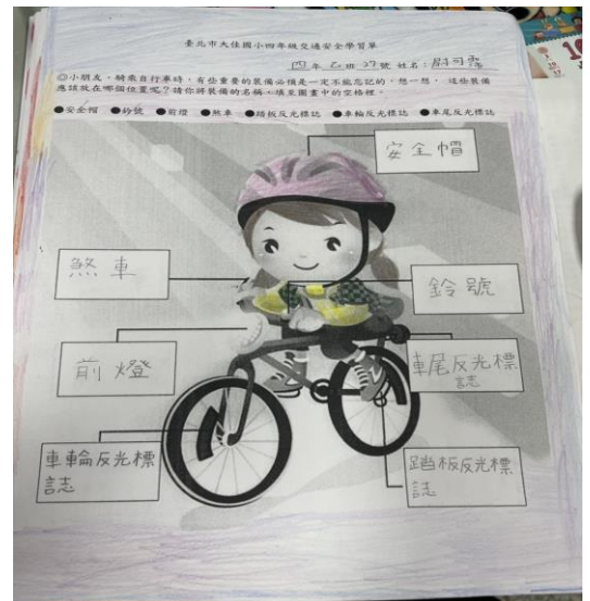
於課程結束後學生寫學習單加深學生學習印象