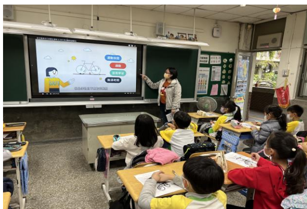
說明：教師講解裝備齊全後，在正式上路之前，還需要徹底檢查腳踏車的各個部位是否狀況良好。