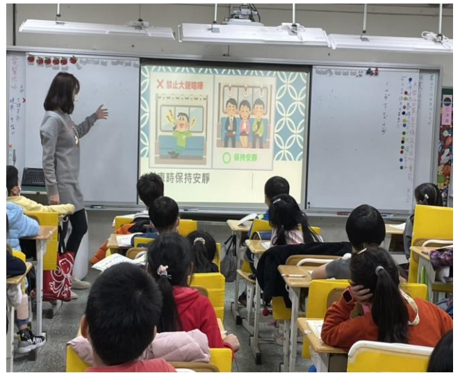
說明：教師講解搭乘公車或捷運注意事項。