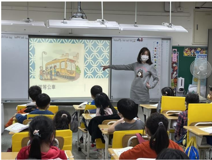
說明：認識乘坐汽、機車及搭公車時的安全注意事項。